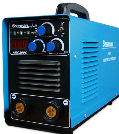
Rys. 1. Widok ogólny urządzenia